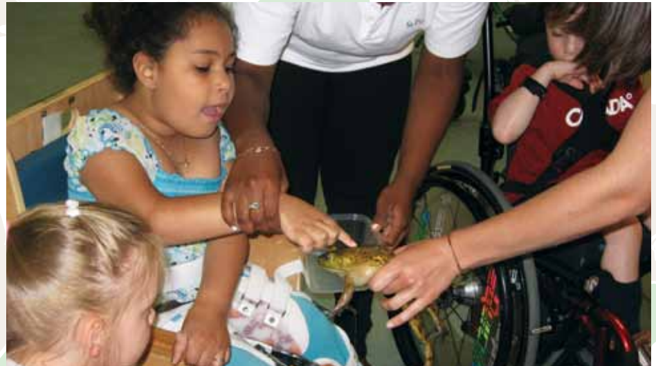
Institut des sciences environnementales du Fleuve Saint-Laurent (St. Lawrence River Institute)

Grâce à des programmes en salle de classe comme « un étang dans la classe » ou les « adaptations animales », l'Institut des sciences environnementales du Fleuve Saint-Laurent donne l'occasion aux élèves qui présentent un handicap physique ou des difficultés de développement de participer à des expériences et d'acquérir des connaissances scientifiques par une approche pratique. Grâce au soutien financier de la FAE TD, l'Institut a pu acheter le matériel nécessaire pour offrir ce programme.