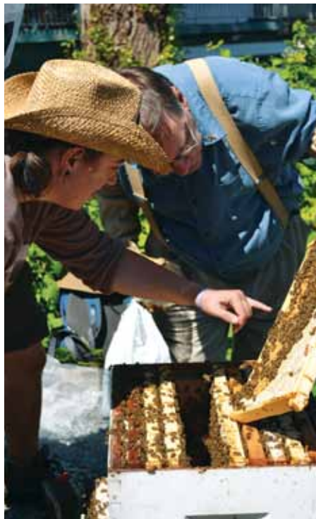
Environmental Youth Alliance

L'Environmental Youth Alliance est un organisme sans but lucratif formé par des jeunes passionnés par la santé des milieux urbains. En réponse au déclin des populations d'abeilles indigènes et domestiques en Amérique du Nord, le Pollinators Project vise à sensibiliser les membres de la collectivité à l'importance du rôle des abeilles et des autres espèces pollinisatrices dans un système alimentaire durable et la santé générale des écosystèmes. Grâce à l'appui de la FAE TD, les jeunes ont pu participer à un programme de formation gratuit de quatre mois sur la gestion durable des populations d'abeilles.