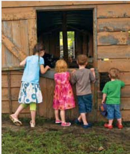
Everdale Organic Farm & Environmental Learning Centre

Le centre Everdale offre une expérience éducative concrète axée sur l'agriculture durable, les énergies renouvelables et les méthodes de construction écologique. En utilisant l'éducation à la ferme pour sensibiliser les élèves à l'environnement, la ferme découverte Everdale leur permet de sortir des classes pour entrer directement en contact avec leur nourriture. Le financement de la FAE TD a permis l'expansion du programme de la ferme Everdale destiné aux jeunes, qui accueille maintenant environ 7 000 élèves par année.