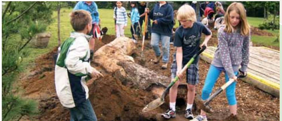
École publique Tweedsmuir

La mission d'Études d'oiseaux Canada consiste à favoriser une meilleure compréhension, appréciation et conservation de l'avifaune en faisant la promotion de la participation du public à des programmes scientifiques de conservation et de surveillance. Au moyen de matériel d'enregistrement autonome qui collecte des données sur les oiseaux, l'organisme a élargi les possibilités de participation de la population aux activités de conservation. Le financement fourni par la FAE TD a permis à Études d'oiseaux Canada d'étendre ses activités de surveillance écologique.