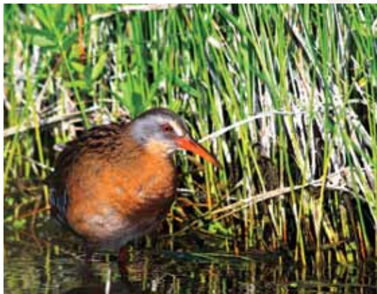
Études d'oiseaux Canada